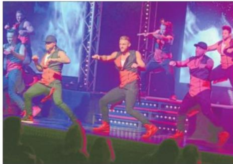
„Sexxy Circus“: Ihre kompletten Anzüge tragen die Sixx Paxx in der Godesberger Stadthalle nur für ein paar Minuten.