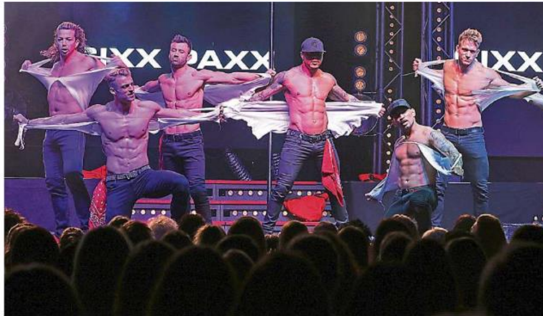
Eine heiße Show lieferte das Ensemble Sixxpaxx im „Wormser“.

► Die Sixxpaxx aus Berlin sind eine „Male Artist Show“, die seit ihrem ersten Auftritt im Jahr 2014 vor allem ihr weibliches Publikum mit viel Sexappeal begeistern. Die nunmehr dritte Tour „Sexy Circus“ startete im Herbst 2017 und führt durch ganz Deutschland und Europa.